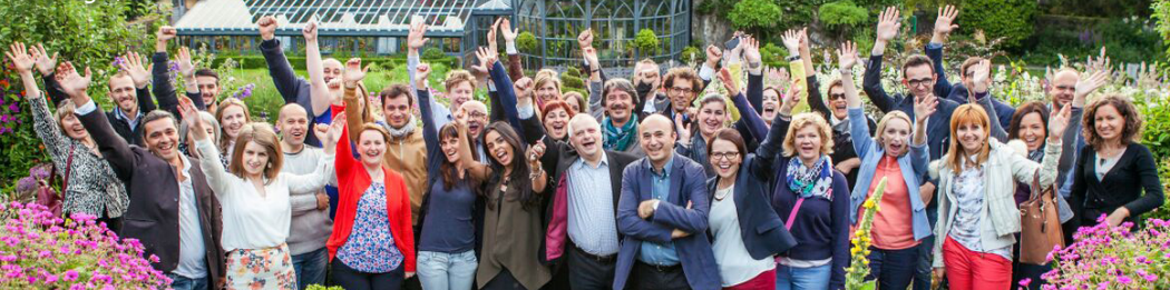
14-16 ta' Lulju 2015 Taħriġ Livell UE fuq DEAR Donegal, Irġanda

In konkluzjoni, l-inizzjattiva čittadini ġurnalisti u l-Kompetizzjoni ta' 'Slogans' it-tnejn se jikkontribwixxu biex jikkomunikaw il-mod kif il-proġett iħares u jqajjem kuxxjenza fuq kwistjonijiet ta' żvilupp b'mod attrajenti għač-čittadin ordinarju. Dawn l-inizzjattivi huma maħsuba fil-pajjiži kollha tal-konsorzju.