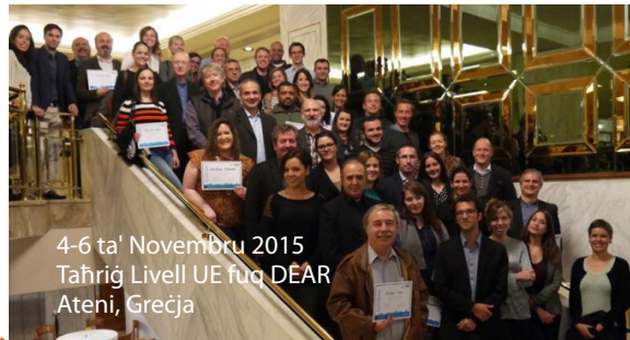
4-6 ta' Novembru 2015 Tahriġ Livell UE fuq DEAR Ateni, Greċja