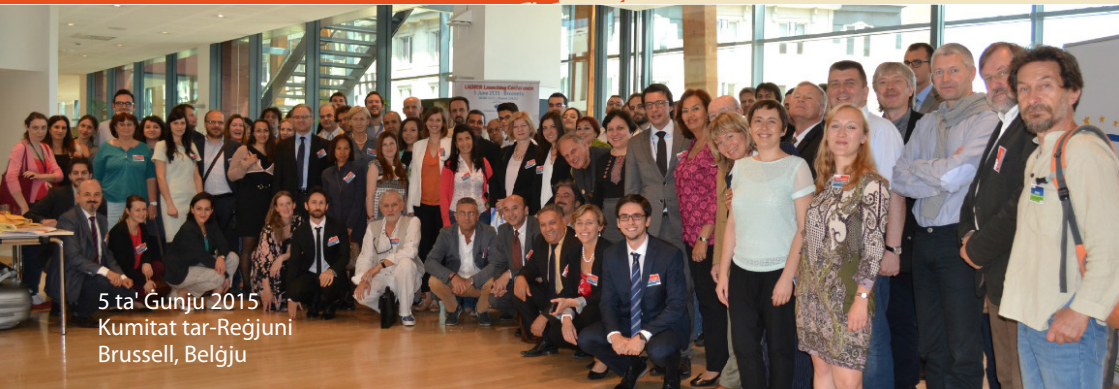
5 ta' Gunju 2015 Kumitat tar-Reġjuni Brussell, Belġju

LADDER huwa proġett ta' 3 snin li huwa ko-finanzjat mill-UE taħt il-programm DEAR.